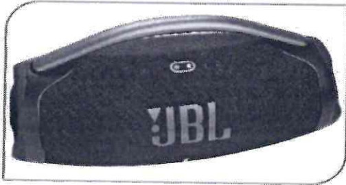
JBL Caixa de Som