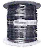
Cabo Rede Preto 500m Bobina Ftp Externo Dc...