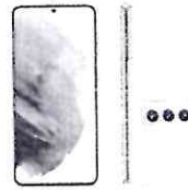
Smartphone Samsung Galaxy S21 128GB 5G Wi-Fi Tela...