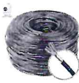
Cabo De Rede Blindado Ftp Cat5e Preto Dupla capa 100...