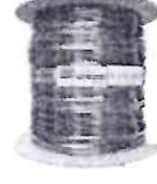
Cabo 4 Pares cftv Preto 300m Bobina Ftp Externo Dc...