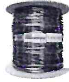
Cabo Rede Preto 1000m Bobina Ftp Externo Dc...