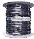
Cabo Rede Preto 500m Bobina Ftp Externo Dc...