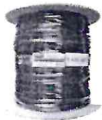
Cabo Rede Preto 100m Rolo Ftp Externo Dc Blindado...