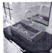
Cuba de Apoio para Banheiro Q45W Retangular Compece...