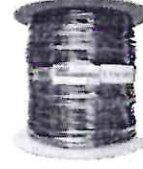
Cabo Rede Preto 100m Rolo Ftp Externo Dc Blindado...